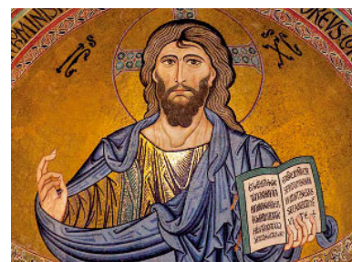
Pantocràtor (s. XII) mosaic bizantí de la catedral de Cefalú (Sicília, Itàlia)